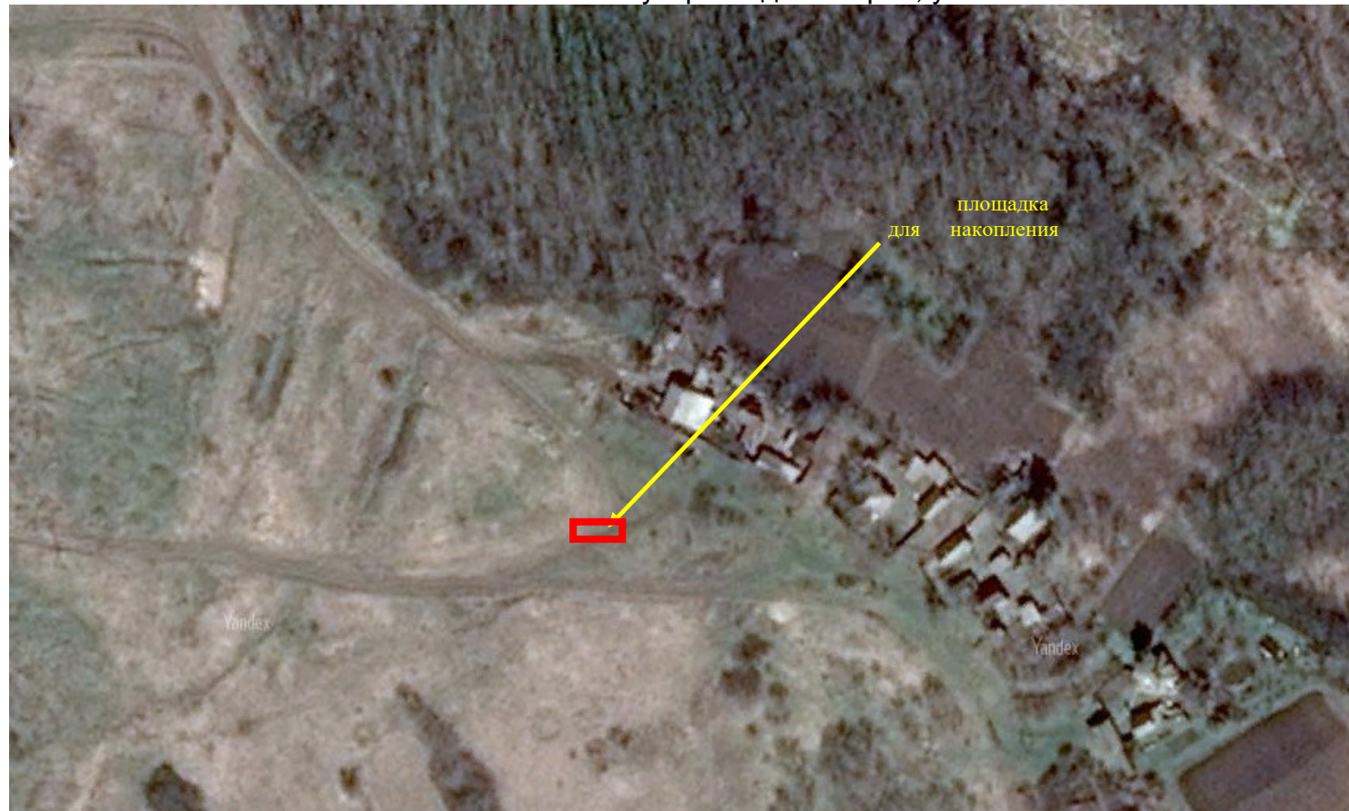
Схема размещения площадки накопления твердых коммунальных отходов на территории Степнянского сельского поселения в хуторе Родина Героя, ул. Лесная

«Приложение № 20 к постановлению администрации Степнянского сельского поселения от 13.02.2020 № 22