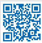
Сервис «Личный кабинет»

Электронный сервис ФНС России «Личный кабинет налогоплательщика для физических лиц» позволяет не выходя из дома: